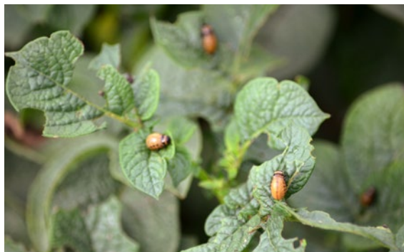
Eine Larve im L4-Stadium frisst bis 50 cm 2 Kartoffellaubfläche pro Tag.