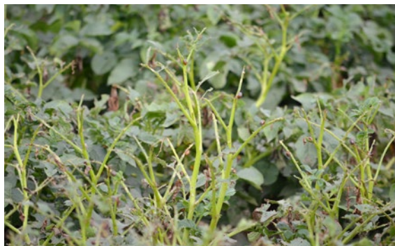
Nicht regulierte Kartoffelkäfer verursachen rasch einen Kahlfrass an Kartoffelstauden und können zu einer grossen Plage werden.

Höhere Temperaturen im Sommer führen zu einer höheren Entwicklungsgeschwindigkeit und Aktivität dieses Insekts. In der Folge kann mehr als nur ein Entwicklungszyklus pro Saison durchlaufen werden. Der zweiten Generation von Larven gelingt dann auch der Reifungsfrass vor dem Winter. Die milden Winter lassen zudem die Ausfallkartoffeln immer seltener erfrieren. Werden diese nicht beseitigt, wachsen sie unbemerkt in Folgekulturen und die Käfer können sich ungestört darauf vermehren. Ein weiterer Faktor ist die Situation bei den zugelassenen Pflanzenschutzmitteln . In den vergangenen Jahren kam es regelmässig zu einer Unterversorgung mit dem bisher bewährten biologischen Mittel Novodor gegen den Kartoffelkäfer. Dies verunmöglichte eine flächendeckend effektive Bekämpfung des Schädlings.