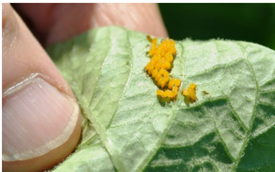
Eiablage auf der Unterseite der Kartoffelblätter.

Nach einem zweiwöchigen Reifungsfrass und mehreren Paarungen beginnen die Weibchen mit der Eiablage. Die anfangs hellen, später orangeroten, etwa 1,5 mm langen Eier werden in Häufchen von etwa zehn bis dreissig Stück auf der Blattunterseite abgelegt. Ein Weibchen kann in ihrem Leben zwischen 200 und 2000 Eier ablegen. Abhängig von der Temperatur schlüpfen nach vier bis vierzehn Tagen die Larven aus ihren Gelegen und beginnen, Löcher in die Blätter zu fressen. Bei sehr kühlen Temperaturen können die Eier jedoch auch geschädigt werden und absterben.