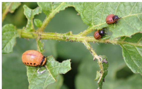
Larven des Kartoffelkäfers in verschiedenen Stadien.

Eine Kartoffelkäferlarve häutet sich dreimal und durchlebt vier Larvenstadien. Im ersten Stadium ist die Larve zwischen ein und drei Millimeter gross. Mit jedem Häutungsvorgang wächst die Larve, bis sie im vierten Stadium rund fünfzehn Millimeter gross ist und die Form einer Birne hat. Abhängig von Temperatur und Nahrungsangebot verpuppt sie sich nach vierzehn- bis dreissigtägiger Frass-tätigkeit rund fünf bis zwanzig Zentimeter tief im lockeren Boden der Kartoffelfelder. Nach einer vierzehntägigen Puppenruhe schlüpfen die neuen Käfer Ende Juni und fressen sich weiter durch die Kartoffelbestände. Die ganze Entwicklung dauert durchschnittlich sechs Wochen, wobei die Entwicklungsdauer stark von der Umgebungstemperatur abhängt. Je nach Klima und Höhenlage kann ein zweiter Zyklus durchlaufen werden, bevor sich die Tiere wieder in ihr Winterquartier vergraben.