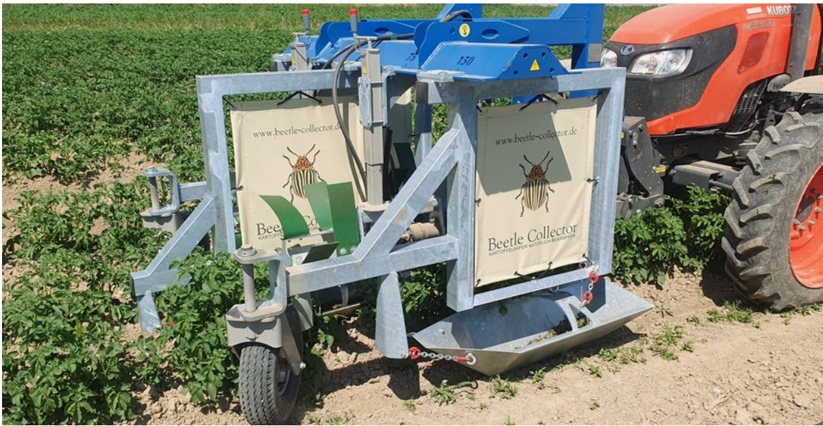
Das Absammelgerät «Beetle Collector» der Firma Gallinger Maschinenbau GmbH im Einsatz.