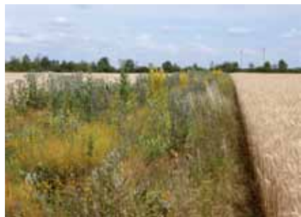
Ein Blühstreifen als Grenze zum Nachbarn