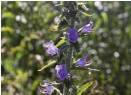
Natternkopf ( Echium vulgare )

Aufgrund dieser Spezialisierung wird auch deutlich, warum es so wichtig ist, dass viele verschiedene Blütenpflanzen für Wildbienen zur Verfügung stehen. Nur ein artenreiches Blühangebot kann zahlreiche Wildbienenarten mit ihren unterschiedlichen Ansprüchen ernähren und ihr Überleben sichern.