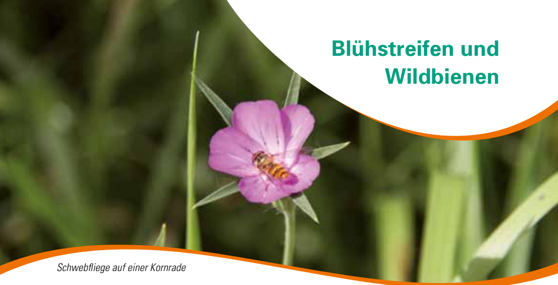
Schwebfliege auf einer Kornrade