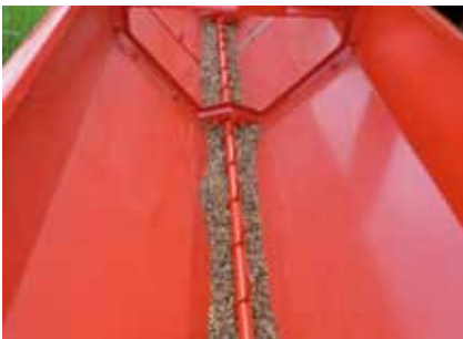
Die unterschiedlichen Samen können sich leicht entmischen

Der Anbau kann mit einer herkömmlichen Drillsämaschine erfolgen, die wegen der zumeist feinen Samen auf das Feinkornsärad umgestellt werden soll. Vor dem Anbau wird mittels Abdreprobe die genaue Saatmenge ermittelt. Da eine Blühstreifenmischung oft aus Samen unterschiedlicher Größe besteht, kann es zur Entmischung im Saatkasten kommen. Daher das Saatgut besser erst unmittelbar