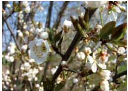
Kirsche ( Prunus sp.)