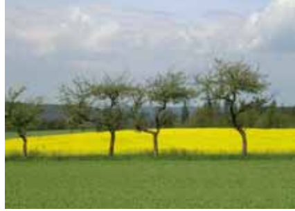
Obstbäume und Raps