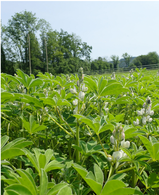
Abbildung 1. Die Weisse Lupine.

Weisse Lupinen ( Lupinus albus ) sind eine andere botanische Art als schmalblättrige oder „blaue“ Lupinen ( Lupinus angustifolius ). Sie vertragen schwerere Böden und haben ein höheres Ertragspotential, reifen allerdings erst im August/September. Wichtig für ihren Anbau ist die Verwendung von gesundem, zertifiziertem Saatgut, eine möglichst frühe Aussaat und die richtige Sortenwahl, um eine Infektion mit der Pilzkrankheit Anthraknose, die über das Saatgut verbreitet wird, zu vermeiden. Hier werden die wichtigsten Erfahrungen aus dem ökologischen Anbau zusammengefasst.