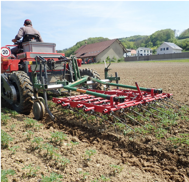
Abbildung 2. Unkrautbekämpfung ist vor allem wichtig zur Vorbeugung gegen Spätverunkrautung. Solange die Pflanzen noch relativ klein sind, können sie gestriegelt werden.

platzfester als die der Blauen Lupinen. Die Samen sind sehr gross, entsprechend muss der Dreschkorb möglichst weit offen sein. Die Dreschtrommel-Drehzahl sollte auf niedrigster Stufe eingestellt werden, die Windleistung sollte für schnelle Strohabtrennung hoch sein. Bei einer Feuchtigkeit über 14 % sollten die Samen schonend (unter 35 °C Lufttemperatur) nachgetrocknet werden.