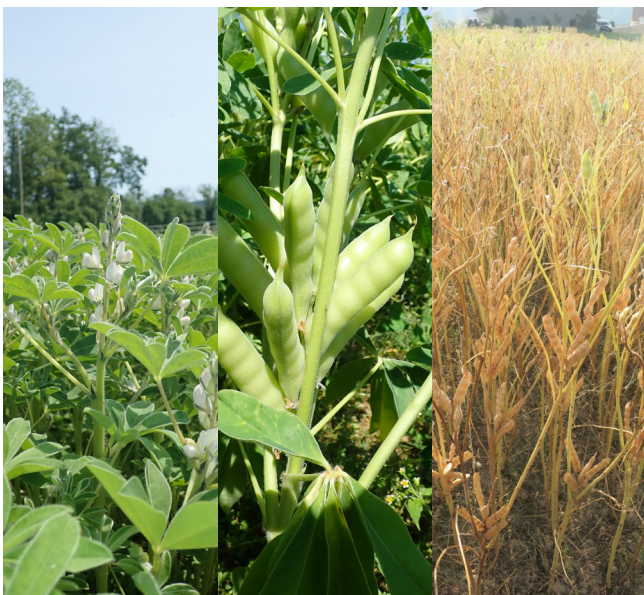
Abbildung 3. Blüte, grüne Hülsen und druschreifer Bestand von Weissen Lupinen.