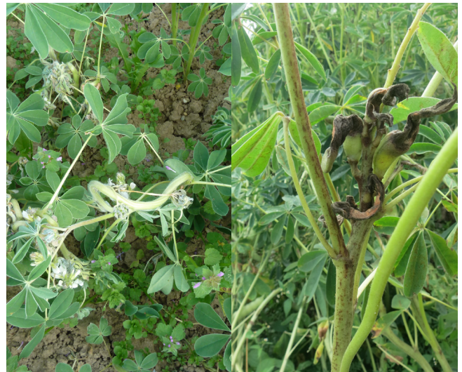
Abbildung 4. Die gefürchtete Brennfleckenkrankheit Anthraknose führt zur Blütezeit zu nesterweise verdrehtem Wuchs der ganzen Pflanzen (links), in der Reifezeit zu schwarzen, verkrümmten Hülsen. (rechts) Zur Blütezeit können die schlimmsten Krankheitsnester von Hand vom Feld entfernt werden.