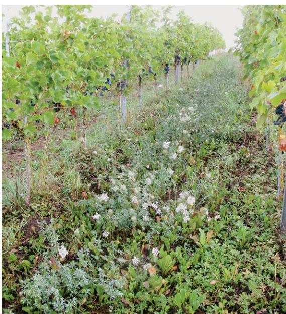
Auch in Rebbergen sind Einsaaten mit standorttypischen Blütenpflanzen möglich.