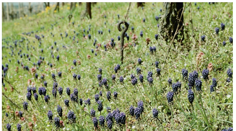
Bei spontaner Begrünung können sich bei lückiger Vegetation in den Fahrgassen und unter den Rebstöcken einjährige Arten und Frühlingszwiebelpflanzen wie die Traubenhyazinthe entwickeln.

Sinnvoller und nachhaltiger als der Einsatz gezüchteter Bestäuber ist die Förderung wildlebender Wildbienen durch Erhöhen des Angebotes an Blüten und Kleinstrukturen; denn damit werden auch viele andere nützliche Insektenarten gefördert.