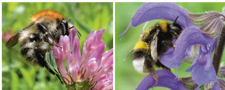
In der Schweiz leben rund 40 Hummelarten.