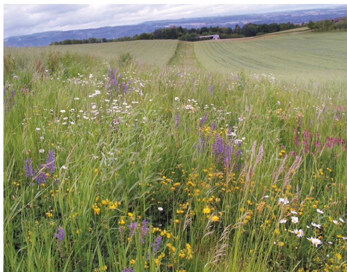
Bestehende, artenreiche Ackerkrautsäume oder angesäte Wiesenblumenstreifen bringen Blütenvielfalt in das sonst vielerorts blütenarme Ackerland.