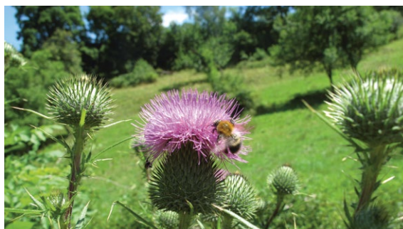
Auch extensiv genutzte Weiden mit Kleinstrukturen und offenen Bodenstellen sind für Wildbienen wertvoll.