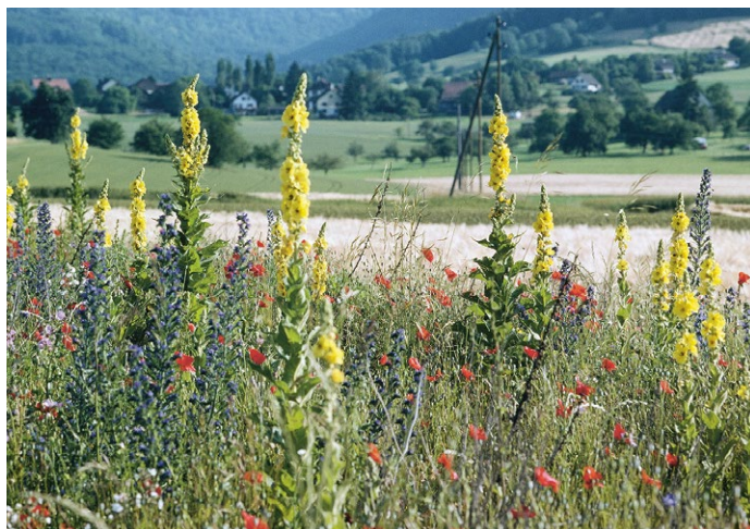
Blühstreifen und Buntbrachen fördern Bestäuber und Nützlinge in Ackerkulturen.