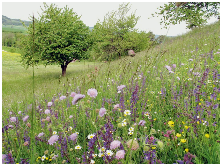
Extensive Wiesen in besonnten Lagen bieten eine reiche Blütenvielfalt.