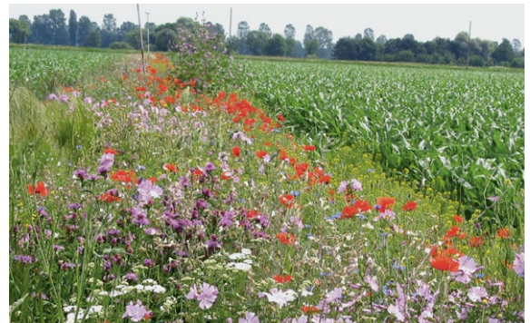
Blühstreifen und Buntbrachen können Wildbienenlebensräume im Ackerland miteinander verbinden.