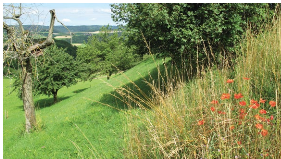
Totholzstrukturen und ein Blütenangebot in der Nähe ermöglichen vielen wenig mobilen Insektenarten ein Überleben.