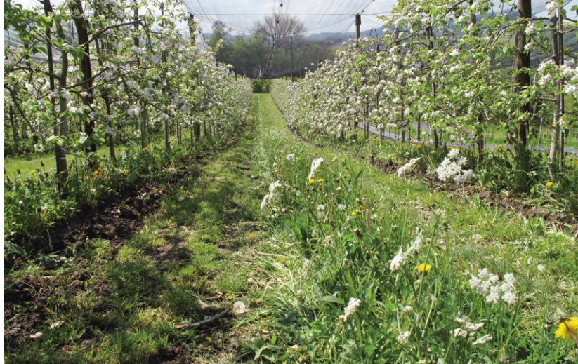
Mehrfährige, artenreiche Blühstreifen aus einheimischen Arten in den Fahrgassen von Obstanlagen fördern Bestäuber und natürliche Feinde von Schädlingen.