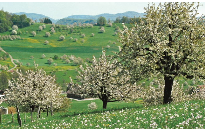
Arten- und strukturreiche Lebensräume tragen am besten zur Erhaltung und Förderung einer vielfältigen Wildbienenfauna bei.

Je vielfältiger und grösser das Blütenangebot in einer Landschaft von März bis Oktober ist, und je mehr geeignete Nistplätze in Form von lückigen Bodenstellen, Totholz, mehrjährigen Stängelstrukturen oder Trockenmauern vorhanden sind, desto mehr Wildbienenarten können sich vermehren. Je kürzer die Entfernung zwischen dem Nest und den Nahrungspflanzen ist, desto mehr Brutzellen kann eine Wildbiene versorgen. Die Nahrungsräume sollten nicht weiter als 100–300 m von den Nistplätzen entfernt sein.