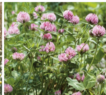
Kleearten in blühenden Kunstwiesen werden vor allem von langrüssligen Hummeln und Honigbienen besucht.