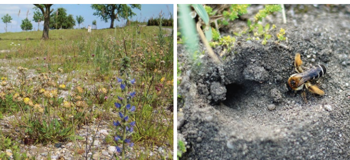
Ruderalflächen bieten Nistmöglichkeiten für bodenbewohnende Wildbienen wie die Hosenbiene.