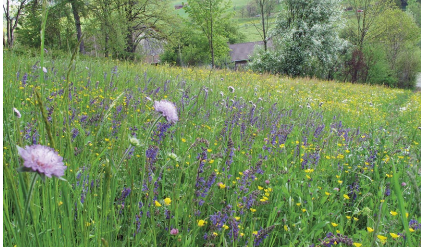
Artenreiche Wiesen bieten viel Pollen und Nektar und fördern damit die Vielfalt an Wildbienen.