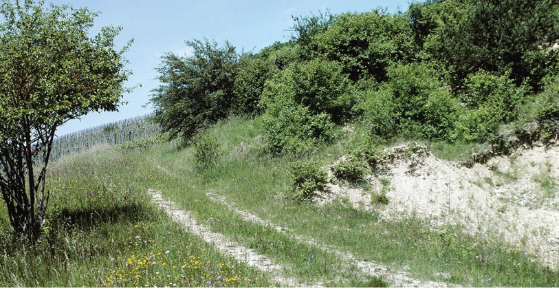
Besonnte Kleinstrukturen mit offenen Bodenstellen gilt es unbedingt zu erhalten. Sie bieten bodennistenden Wildbienenarten Brutmöglichkeiten und Nestmaterial.