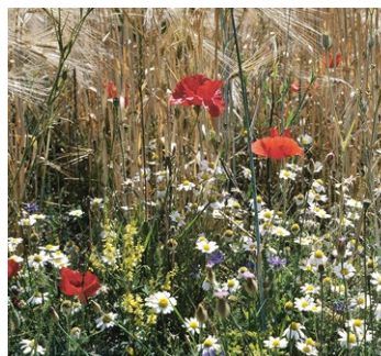
Viele Ackerwildkräuter wie Kamillen, Senfe, Kornblume und Mohn sind wertvolle Pollen- und Nektarquellen für Wildbienen.