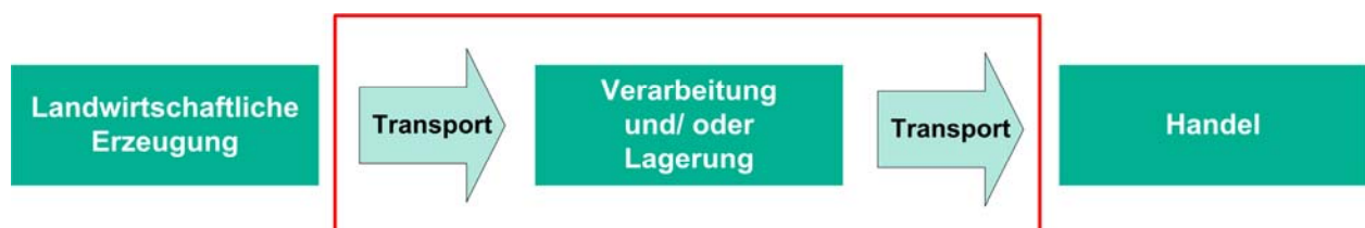
Abbildung 3 Systemgrenzen der Wissensstandsanalyse

Betrachtungsgegenstand der Wissensstandsanalyse ist die Bioverarbeitung für die vier Verarbeitungsbereiche Getreide, Molkereiprodukte, Fleisch sowie Obst und Gemüse. Es wurde nicht die gesamte Wertschöpfungskette betrachtet, sondern es wurden folgende Systemgrenzen festgelegt (Abbildung 3): Die Bereiche Rohstoffqualität/-bezug und Rezepturengestaltung wurden nicht in die Betrachtung einbezogen, da sie sich je nach Beschaffungssituation und individueller Firmenphilosophie stark unterscheiden. Allerdings haben beide Einflussgrößen eine mitbestimmende Wirkung auf die Nachhaltigkeit eines Produktes.