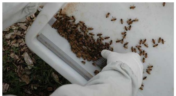
Entnahme der Bienenprobe (siehe 1. Schritt)