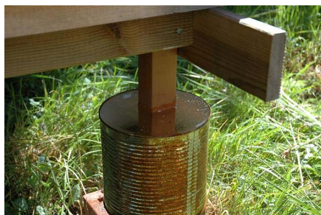
Ameisenschutz (Blechdose mit Wasser gefüllt)