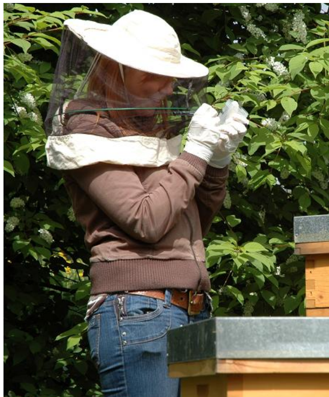
Beschriftung der Becher für Bienenprobe

Wesentliche Teile der alternativen Varroabekämpfung (AVB) wurden von der «internationalen Varroagruppe» unter der Leitung des Schweizerischen Zentrums für Bienenforschung (Agroscope Liebefeld-Posieux ALP) entwickelt.