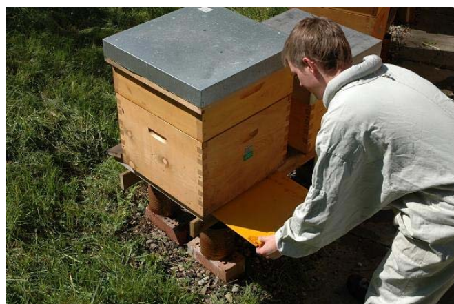
Einführen der Bodeneinlage