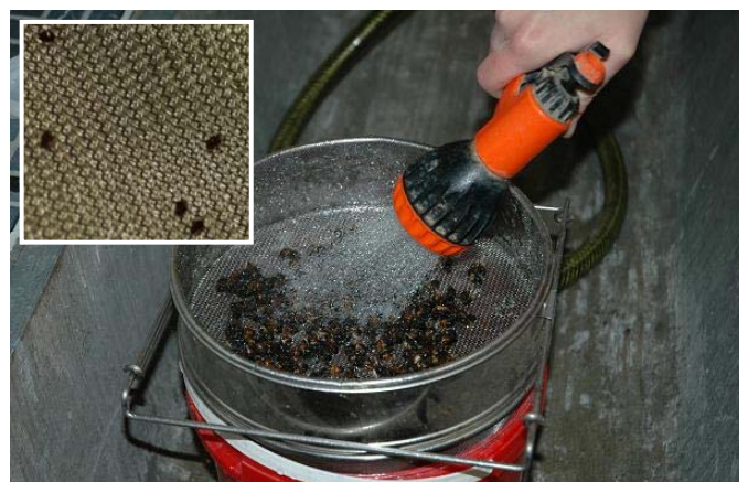
Bienen abspülen; Varroa im Feinsieb (siehe 5. Schritt)