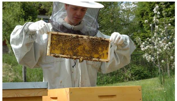
Entnahme einer zentralen Honigwabe (siehe 1. Schritt)