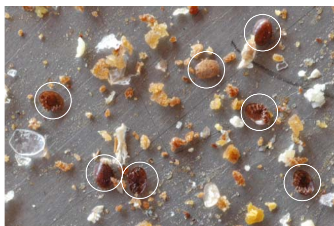
Varroa auf der Einlage