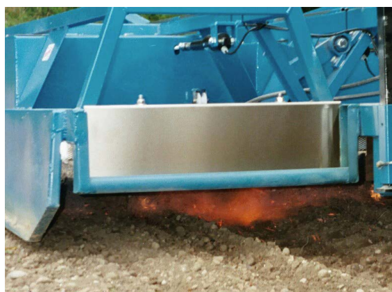
Abflammen im Voraufbau

Bei Kulturen mit langer Keimdauer haben frisch keimende Unkräuter teils erheblichen Entwicklungsvorsprung. Kommt das Blindstriegeln wegen zu flacher Saatablage (unter 3 cm) nicht in Frage, so kann kurz vor dem Auflaufen der Kultur abgeflammt werden. 3–5 mm Erdüberdeckung des Keimschlauches reichen in der Regel zum Schutz der Kultur. So läuft die Kulturpflanze auf einem unkrautfreien Feld auf. Mit diesem bedeutenden Vorsprung werden im Voraufbauverfahren fast alle keimfähigen Unkräuter erfasst. Da die Keimzeiten je nach Jahreszeit und Witterung sehr verschieden sein können, ist es oft schwierig, den optimalen Einsatzzeitpunkt, also den Tag direkt vor dem Durchstossen der Keimblätter zu erkennen.