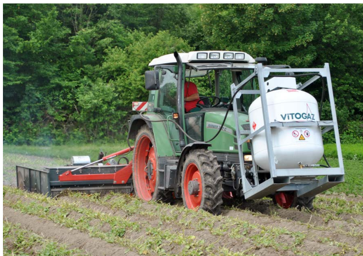
Modernes Abflammgerät mit Fronttank an der Fronthydraulik

Im Kommunalbereich sind die entscheidenden Kosten die Personalkosten zur Bedienung und nicht die Gerätekosten. Der Preis für eine Gasflasche des Typs PNS mit Tauchrohr zur Flüssigentnahme und 10.5 kg Inhalt beträgt ca. Fr. 47.–.