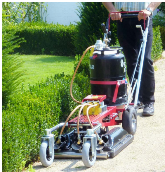
Älteres Abflammgerät zum Schieben von Hand für den Kommunalbereich

Im Kommunalbereich werden typischerweise Brenner mit Infrarot-Wärmestrahlung eingesetzt, die nur indirekt wirken. Temperaturen bei diesen Brennern erreichen bis zu 925 °C. Sie haben einen geringeren Energieverbrauch, aber auch eine vergleichsweise langsame Arbeitsgeschwindigkeit. Der Betrieb ist diskret. Kleine Unkräuter im Wärmeschatten werden allerdings mit diesen Brennern nicht erfasst.