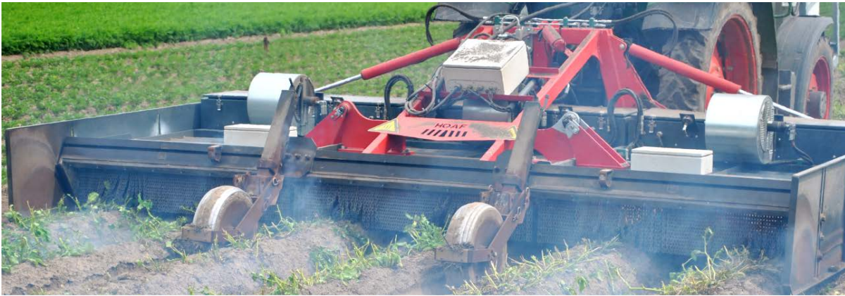
Abflammen von zuvor geschlegelten Frühkartoffeln