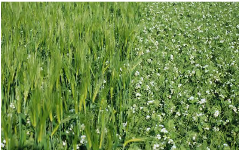
Ляво: полски грах (вариетет с бели цветове) в смесена култура с ечемик; в дясно – чиста култура

Според многогодишните опити на FiBL, отглеждането на селектирани зърнено-бобови под формата на смесена култура със зърнено-житни е алтернатива на вносните бобови. Съвместното отглеждане на бобови и житни култури вече е намерило своето място като силаж и е познато в земеделието. Фактът, че фуражните заводи и мелници отказват да приемат смесени зърна, спира производителите да оставят тези посеви да узреят и да ги прибират не за силаж, а като смесено зърно.