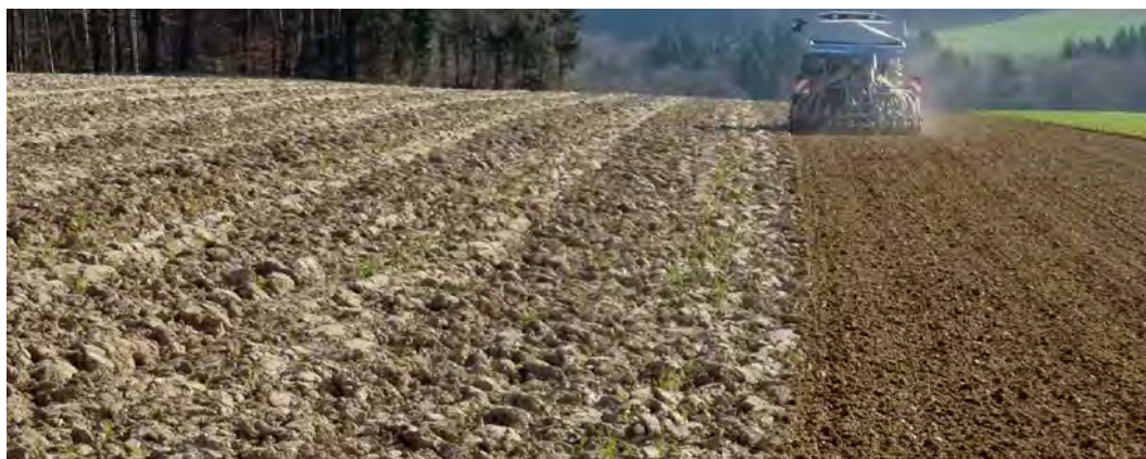
Грахът предпочита леки, с дълбока основа почви без уплътняване.