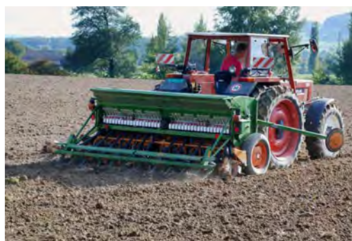
Смеските могат да се засяват и с обикновени сеялки за житни