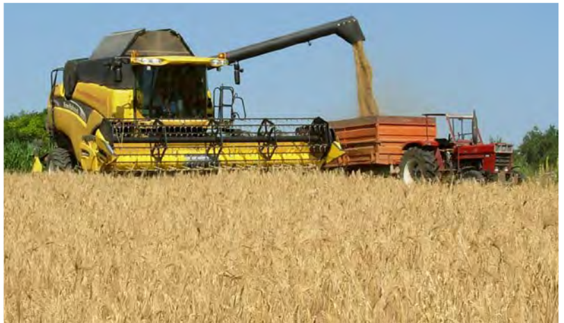
При внимателна настройка реколтата може да се събира с всеки нормален комбайн.