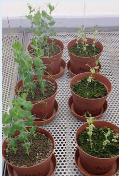
Чрез лесен опит в саксия почвите с умора от бобовите могат да се идентифицират преди засаждането на грах; вдясно: почва с умора от бобовите.

При феномена „умора на почвата от бобовите“, грахът (и отчасти и други бобови) виреят лошо или спират изобщо да растат поради различни почвени заболявания.