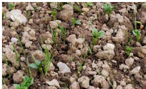
По-грубо подготвената почва намалява риска от образуване на тиня