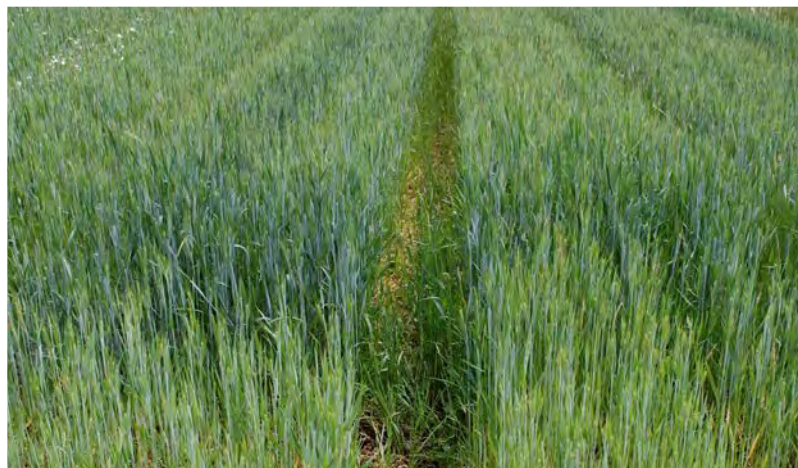
Наторяването с течен оборски тор стимулира растежа на житното в смесената култура за сметка на бобовото.

Зеленото торене или внасянето на компост от оборски тор преди сеитбата е с положително въздействие за здравето на бобовите и води до доставяне на повече фосфор и калий.