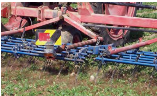
При повече плевели и на по-леки почви минаването на шригелната брана е целесъобразно през март.

Поради бавното си развитие през пролетта пролетниците са по-податливи на заплевеляване от есенниците. Затова, ако се сее през пролетта, е важно да се извърши механично регулиране на плевелите през април/май.