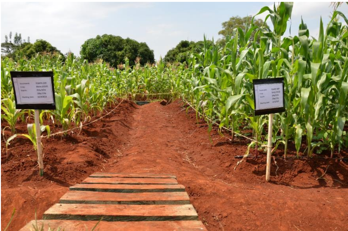
In Kenia ist Mais die Hauptkultur. Im Biolandbau wird er oft abwechselnd mit Leguminosen, Gemüse oder Kartoffeln angebaut. Diese anderen Kulturen in der Fruchtfolge sind enorm wichtig für das Einkommen und die Ernährung der lokalen Bevölkerung.