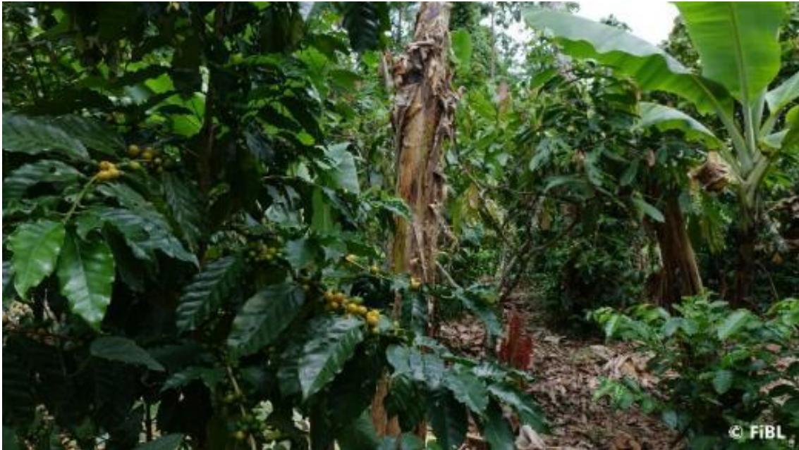
Biologische Anbausysteme (wie das abgebildete bolivianische Kakao-Agroforstsystem mit Begleitkulturen wie z. B. Bananen, Curcuma, Ingwer oder Mais) sind durch das Zusammenspiel von Hauptkulturen mit Begleitkulturen ebenso profitabel wie konventionelle Systeme.